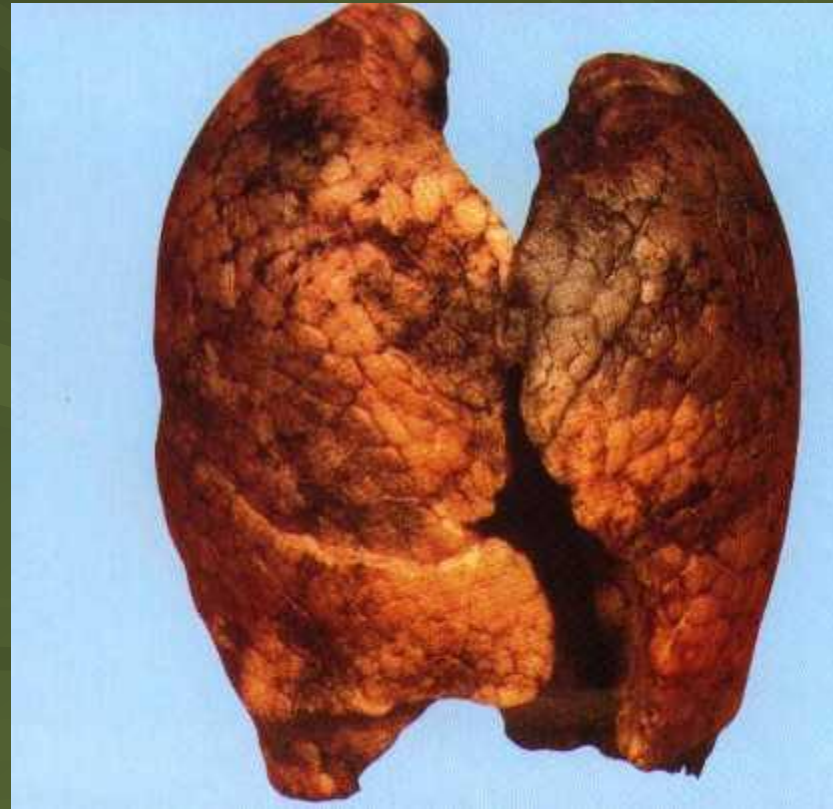
Лёгкие курящего человека